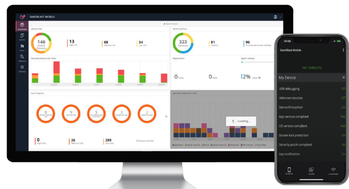
Harmony Mobile Managementkonsole